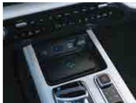
Сымсыз зарядтау құрылғысы. USB порттары (Type A, Type C), 12 V.