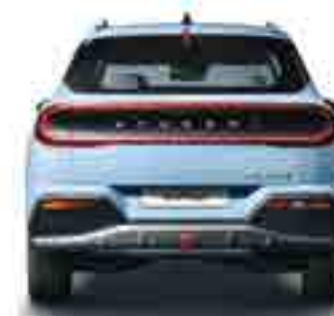
Жолтабан өні 1617/1624