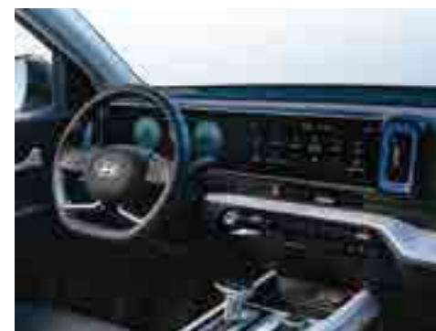
12 дюймдік аспаптар тақтасы және сенсорлық экран.