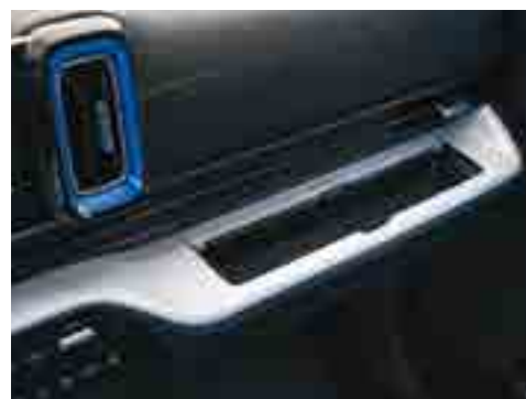
Алдыңғы жолаушының алдында, кішкене заттарға арналған сақтау орны.