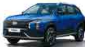
YP5 Қанық көгілдір (Intense Blue Pearl)