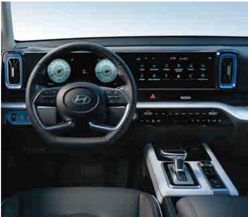
Жүргізу режимдерін таңдау мүмкіндігі бар виртуалды аспаптар тақтасы.