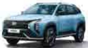
RG6 Мұзды көк інжулі (Ice Blue Pearl)