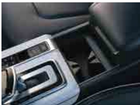
Карточкаларды сақтауға арналған орын.