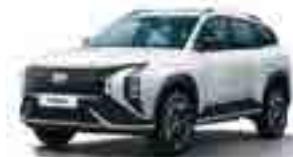
RBC Ақ (White)