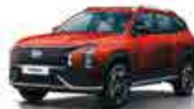
WR7 Айдаһар қызыл (Dragon Red Pearl)