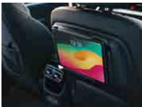
Планшетке арналған бекітпе.