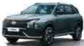
M2G Сұр хаки (Military Grey)