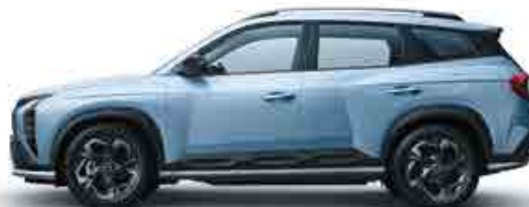
Жалпы ұзындығы 4 475 Дөңгелек базасы 2 680