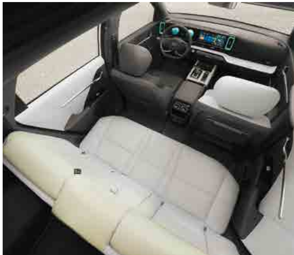
MUFASA моделінің ерекшеліктерінің бірі - көп аймақтылық, яғни жүргізуші аймағы (орындық және есік картасы) түспен ерекшеленген.