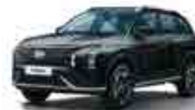
NKA Қара (Phantom Black Pearl)