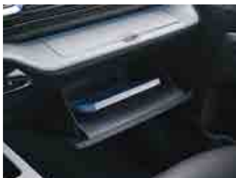
Артқы жолаушылардың есіктеріндегі қобдишалар.