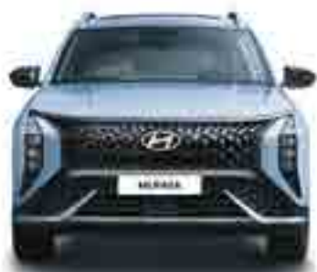
Жалпы өні 1 850 Жолтабан өні 1617/1624